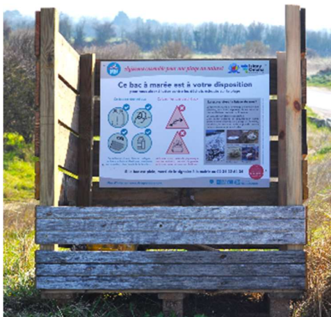
Bac à marée du parc à huîtres

Depuis quelques années, la municipalité a choisi d'installer quatre bacs à marée afin d'être en mesure d'évacuer tout déchet présent sur les plages. Ils sont implantés au Pont du Hable, en bas de la rue de l'église, quai du Petit-Nice et à la sortie des parcs à huîtres. Et pour compléter, plusieurs opérations de nettoyage des plages sont prévues au printemps et en été. Ainsi, toutes les personnes volontaires pour participer à ces gestes collectifs sont les bienvenues.