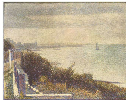
La Manche à Grandcamp (1885)

Nous pouvons nous enorgueillir d'avoir accueilli ce peintre si original. Soyez-en curieux !!! D'ailleurs, il existe, près de la mairie, une rue Georges-Seurat !